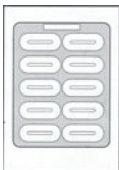
CAPSULE 000 x 10