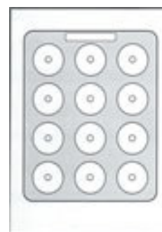
COMPRESSE Ø 13 x 6,5 H x 12