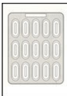
CAPSULE 0 / 1 / 2 x 15