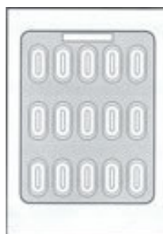
CAPSULE 2 / 3 / 4 x 15